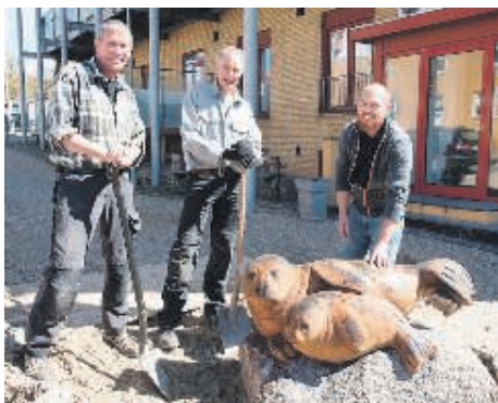
Denne sælskulptur på Ndr. Beddingsvej, som blev indviet i april 2015, får senere på året selskab af et nyt kunstværk.

"Jeg glæder mig til, at styregruppen finder det helt rigtige kunstværk, som med afsæt i lyset, byens virkelyst og Hundestedets maritime