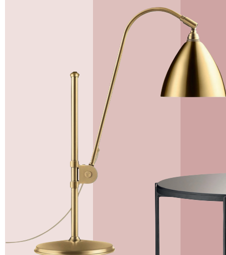
Bestlite BL2, bordlampe i messing. H 50 cm, 5.195 kr. (Gubi).

Foråret og sommeren er højtid for nogle af livets allerstørste fester. Så skal du til bryllup, barnedåb, konfirmation eller måske studentergilde, får du 48 gode bud på gaver, der ikke sprænger budgettet, og som holder år efter år.