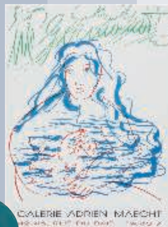
Germana, reproduktion af udstillingsplakat fra 1988. 51 x 70 cm, 225 kr. (Stilleben).