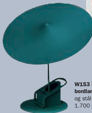
W153 île, væg- og bordlampe i aluminium og stål. H 16 x Ø 19 cm, 1.700 kr. (Stilleben).