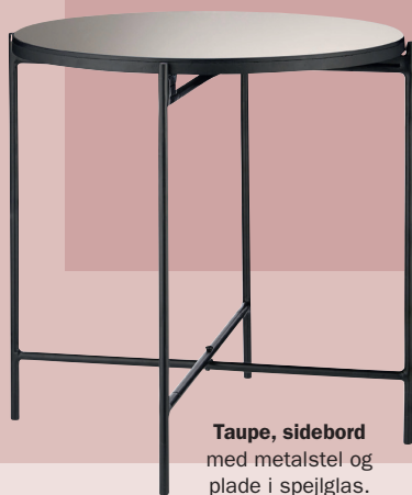
Taupe, sidebord med metalstel og plade i spejlglas. H 40 x Ø 38 cm, 899 kr. (H. Skjalm R).