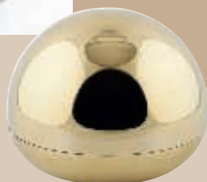
Hemisphere Brass Large, smykseskrin designet af Fort Standard, 1.395 kr. (Stilleben).