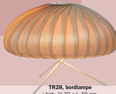
TR28, bordlampe i birk. H 30 x L 40 cm, 4.190 kr. (Tom Rossau).