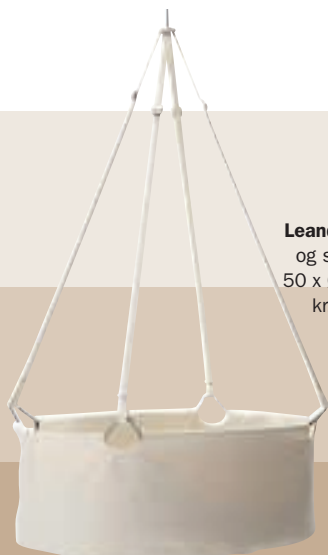
Leander, vugge i træ og stof til loftet. H 50 x Ø 30 cm, 1.599 kr. (Jollyroom).