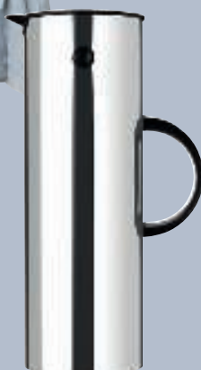
EM77, kaffekande i stål. H 31 cm, 800 kr. (Stelton).