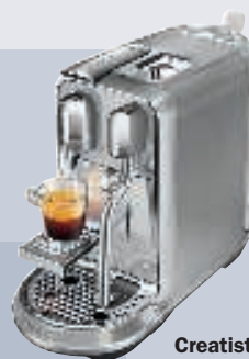
Creatista Plus, kaffemaskine. 3.699 kr. (Nespresso).