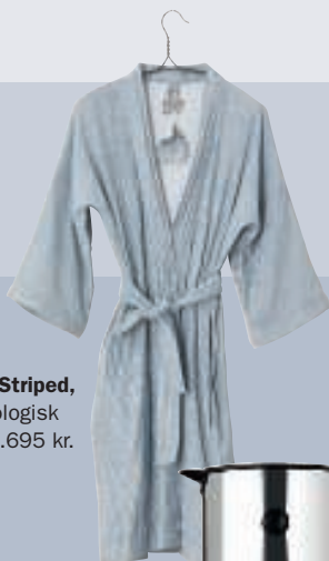
Bathrobe Striped, kåbe i økologisk bomuld. 1.695 kr. (Aiayu).