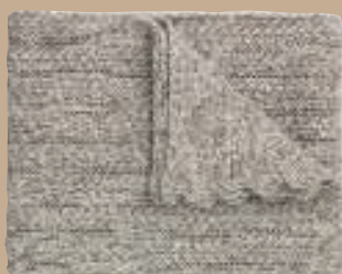
Baby Mollie, plaid i 100 % lamauld. L 100 x B 80 cm, 1.295 kr. (Aiayu).