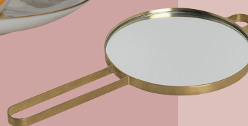
Poise, håndspejl i messing. Ø 14,5 cm, 499 kr. (Ferm Living).