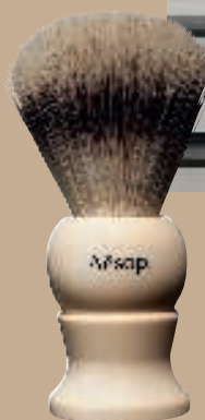
Shaving Brush, børste til barbering, 510 kr. Double-Edge Razor, barberskraber , 720 kr. (Aesop).