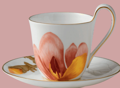
Magnolia, kop med underkop, 399 kr. (Royal Copenhagen).