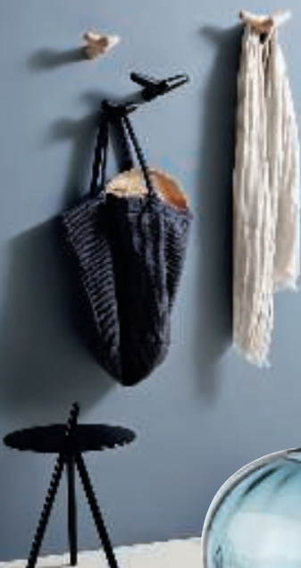
Tail wing, knager i træ. 329/429 kr. (Woud).