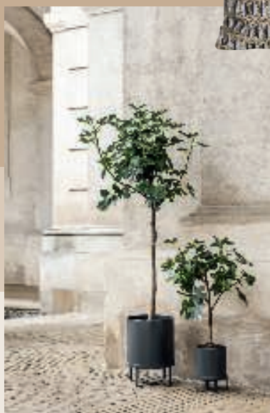
Bau, potter i galvaniseret og pulverlakeret stål. H 38/24 cm, 499/299 kr. (Ferm Living).