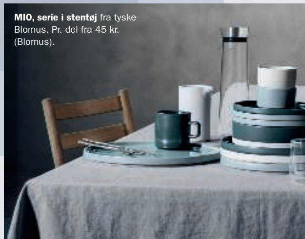
MIO, serie i stentøj fra tyske Blomus. Pr. del fra 45 kr. (Blomus).