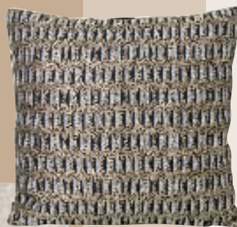
Leaf, pude. 40 x 40 cm, 849 kr. (Ferm Living).