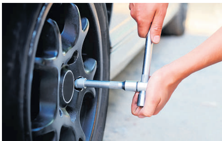
Den livsfarlige trend med at løsne hjulbolte er tilsyneladende kommet tilbage.