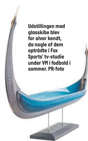
Udstillingen med glasskibe blev for alvor kendt, da nogle af dem optrådte i Fox Sports' tv-studie under VM i fodbold i sommer.