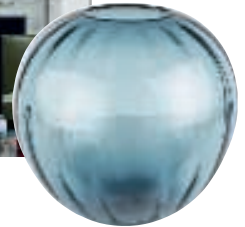
Rund glasvase, Glassmedjen hos Stilleben, 1.950 kr.