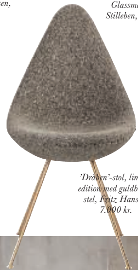
'Dråben'-stol, limited edition med guldbelagt stel, Fritz Hansen, 7.000 kr.