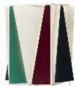
'B-4'-bordlampe designet af Greta M. Grossman, Gubi, 1.895 kr.