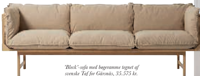
'Bleck'-sofa med bogeramme tegnet af svenske Taf for Gärsnäs, 35.575 kr.