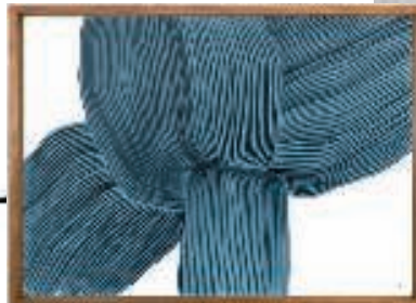
Nummereret Bouroullec-print, The Wrong Shop, 3.350 kr.