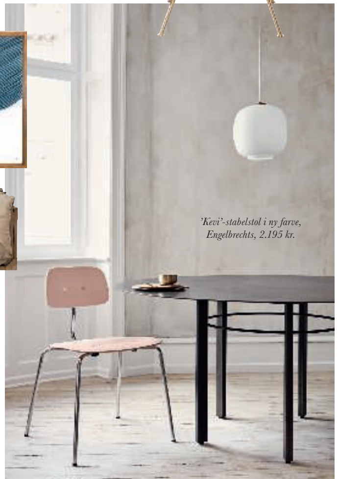
'Kevi'-stabelstol i ny farve, Engelbrechts, 2.195 kr.