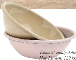
'Enamel'-emaljeskåle, Hay Kitchen, 129 kr. pr. stk.