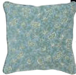
Pude med vintagetekstil, Helle Thygesen, 900 kr.