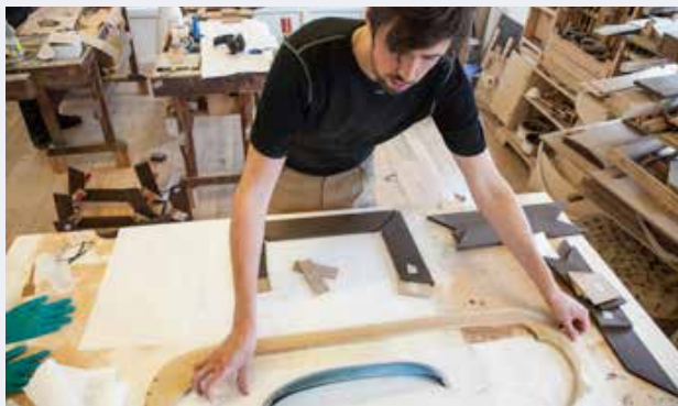
Snedkeriet Egeværk i Hundested.